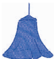
DC1 AZUL MARINO