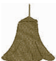
DC5 MARRÓN CLARO

Los colores anteriores están disponibles en todas las formas y tamaños. Los colores mostrados son sólo indicativos y podrían variar ligeramente.