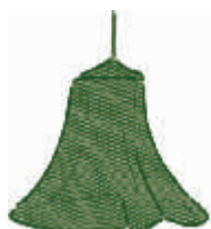
DC2 VERDE OSCURO