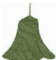
DC3 VERDE OSCURO