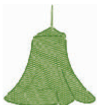
DC4 VERDE MADAGASCAR