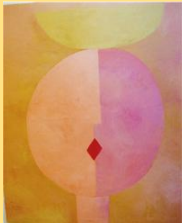
Autor: Marta Iglesias. "Besos con cesto"

Tenemos una filosofía de trabajo basada en la acción. Creemos firmemente en las personas, en su capacidad de acción y en sus posibilidades de cambio. Favorecemos la participación activa de nuestros beneficiarios. Respetamos la cultura y las costumbres. Mantenemos una gestión comprometida y transparente. Tenemos vocación de permanencia.