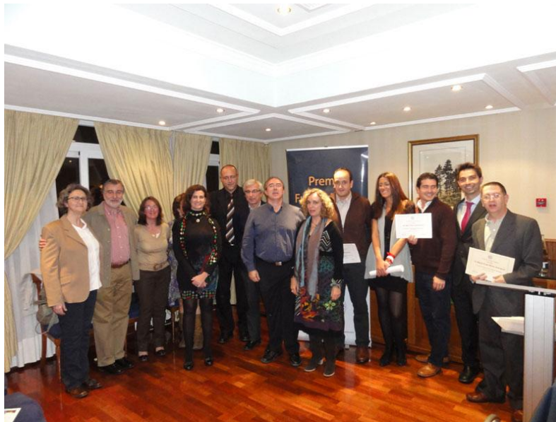
Jurado y ganadores de la I Edición de Premios IO

El presidente de la Fundación IO defiende la necesidad de impulsar la formación de personal sanitario y no sanitario en enfermedades infecciosas